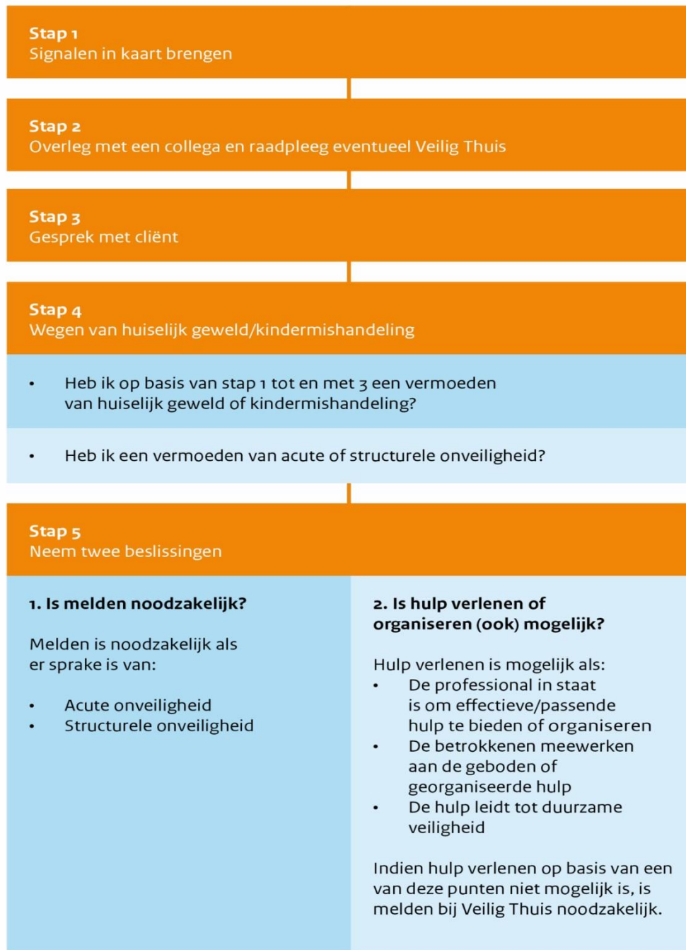
Figuur 1: Stappenplan verbeterde meldcode

De 5 stappen van de meldcode gaan in vanaf het moment dat er signalen zijn geconstateerd. Signaleren wordt gezien als een belangrijk onderdeel van de beroepshouding van de medewerkers die binnen de organisatie werkzaam zijn. Zo gezien is signalering geen stap in het stappenplan, maar een grondhouding die in ieder contact met het kind en de ouder wordt verondersteld. De stappen wijzen de medewerker de weg als hij meent dat er signalen zijn van huiselijk geweld of van kindermishandeling. De medewerker kan gebruik maken van signalenlijsten.